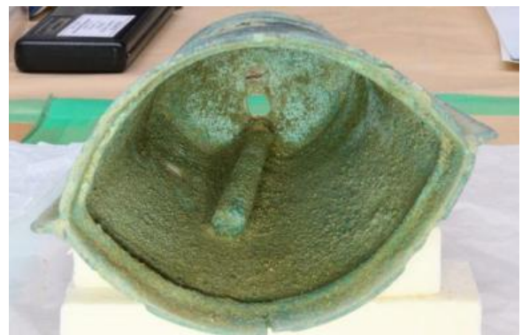
6号銅鐸内、6号舌検出状況