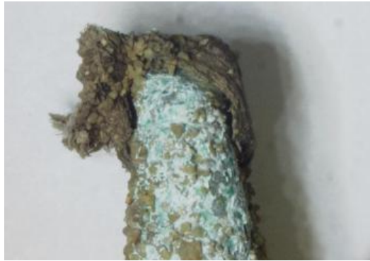
6号舌 孔をくぐるひも(横面)