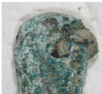
7号舌 孔をくぐるひも(下面)