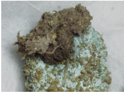
6号舌 孔をくぐるひも(上面)