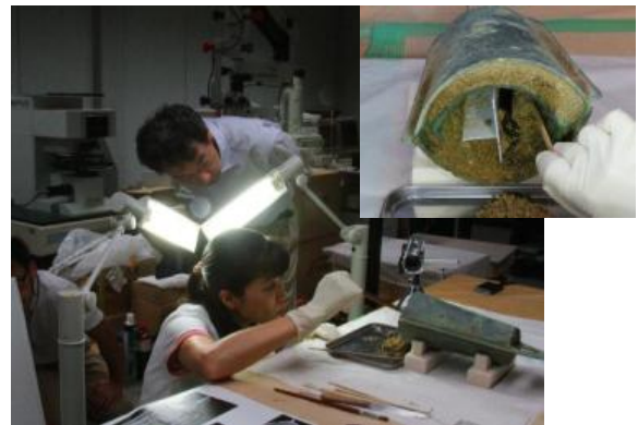
6・7号銅鐸内部の砂取り出し状況