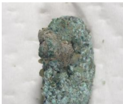
7号舌 孔をくぐるひも(側面)