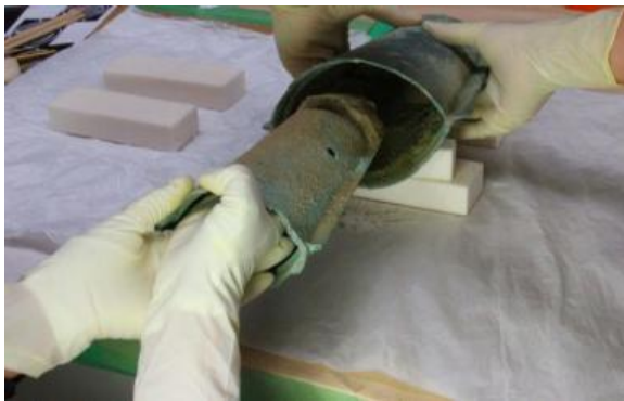
6号銅鐸から7号銅鐸取り出し