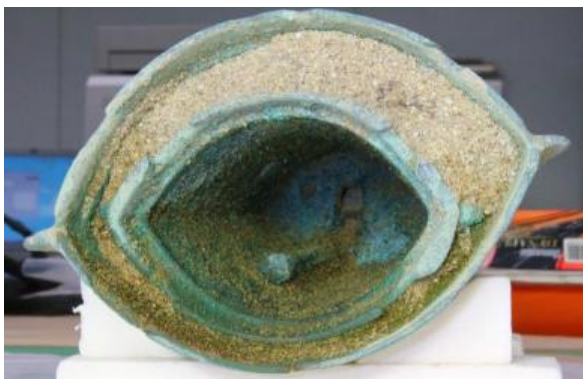
7号銅鐸内、7号舌検出状況