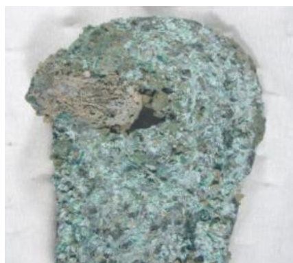
7号舌 孔をくぐるひも(上面)