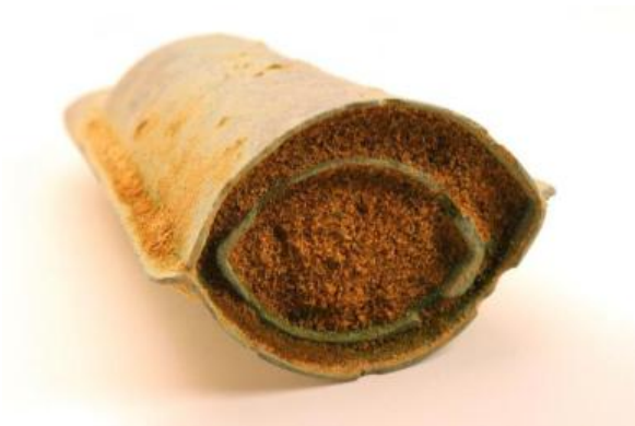
入れ子状態の6・7号銅鐸